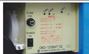
搭載型バッテリー充電器 (AC100V) コードリール付 (コード長さ約1.5m)

※最大積載質量 (kg) は搭乗者を含む積載荷重です。 ※充電器は搭載型自動充電方式 (AC100V)