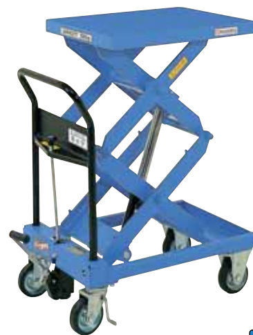
急降下防止バルブ付