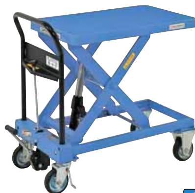
急降下防止バルブ付