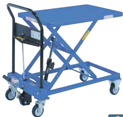
急降下防止バルブ付