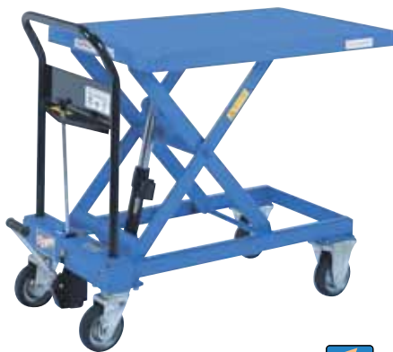
急降下防止バルブ付