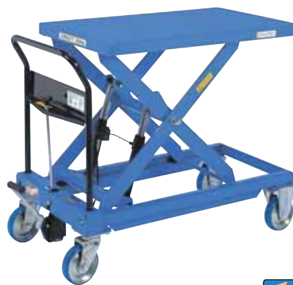
急降下防止バルブ付