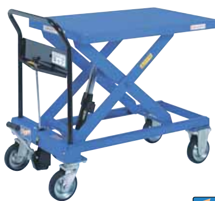
急降下防止バルブ付