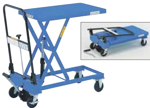
ハンドル折りたたみ式