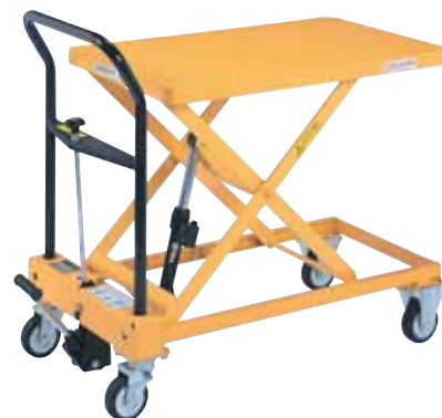
急降下防止バルブ付