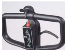
走行操作ハンドル